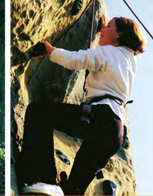
Kletterzentrum „Big Wall“, Bösensell