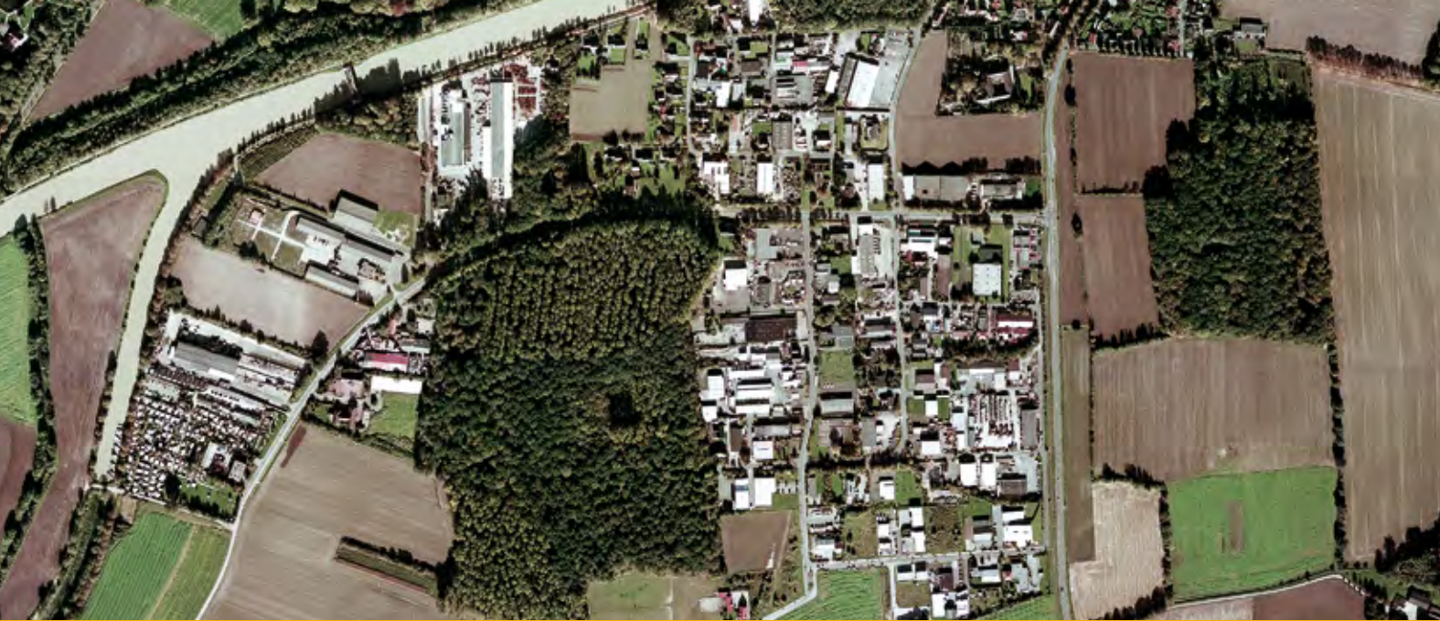
Luftbildaufnahme Gewerbegebiet Senden