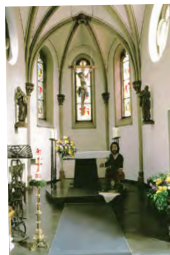
St. Johanniskirche, Venne