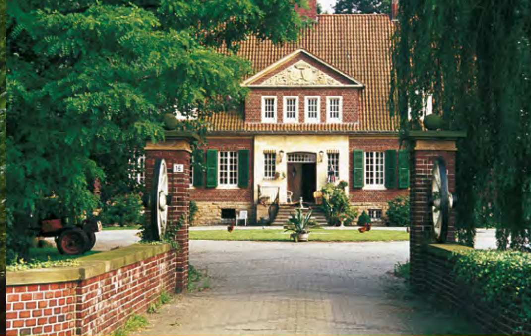
Haus Walbaum, Ottmarsbocholt