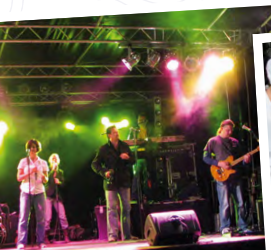
12 | „Street Live“