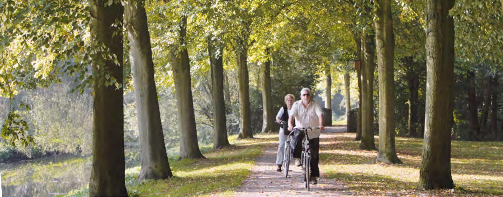
Radwandern entlang der Stever