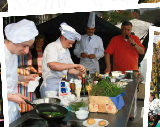
Maifest „Senden tischt auf“