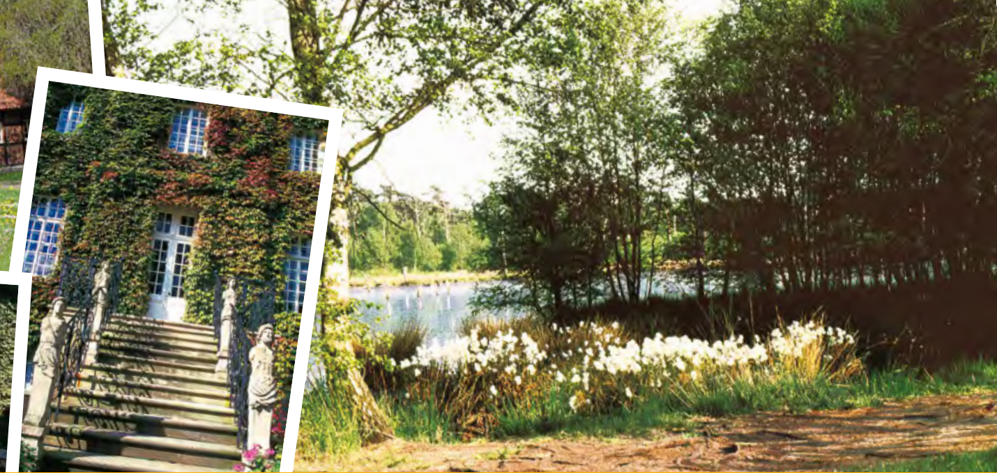
Haus Ruhr, Bösensell, rechts: Naturschutzgebiet Venner Moor