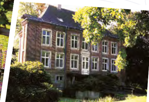
Haus Alvinghof, Bösensell