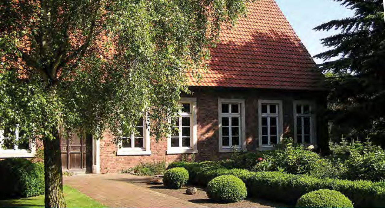
Haus in Bösensell