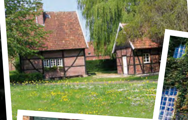
oben: Spieker und Backhaus, Ottmarsbocholt, unten: Typisch westfälisches Fachwerk