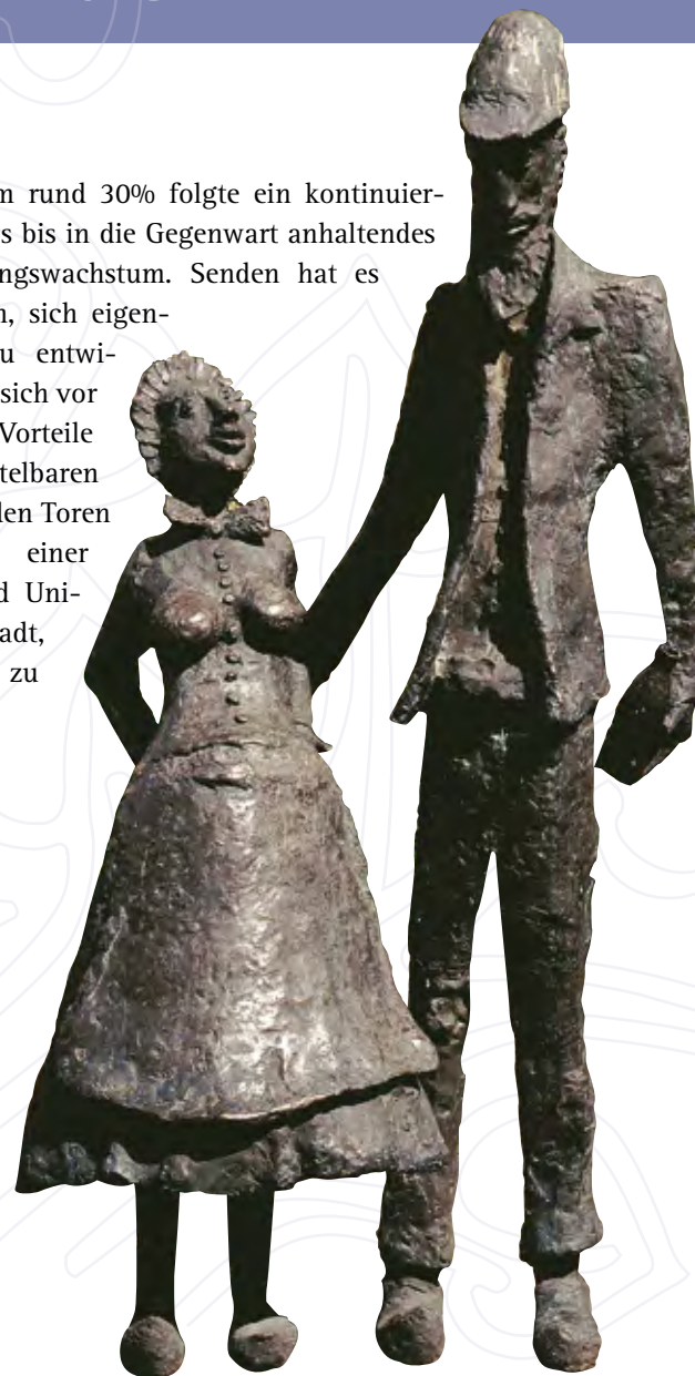
„Nies und sine Fru“

anstieg um rund 30% folgte ein kontinuierlich starkes bis in die Gegenwart anhaltendes Bevölkerungswachstum. Senden hat es verstanden, sich eigenständig zu entwickeln und sich vor allem die Vorteile der unmittelbaren Lage vor den Toren Münsters, einer Groß- und Universitätsstadt, zu Nutze zu machen.