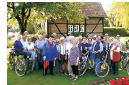
Kiepenkerlbegrüßung vor dem „Spieker“